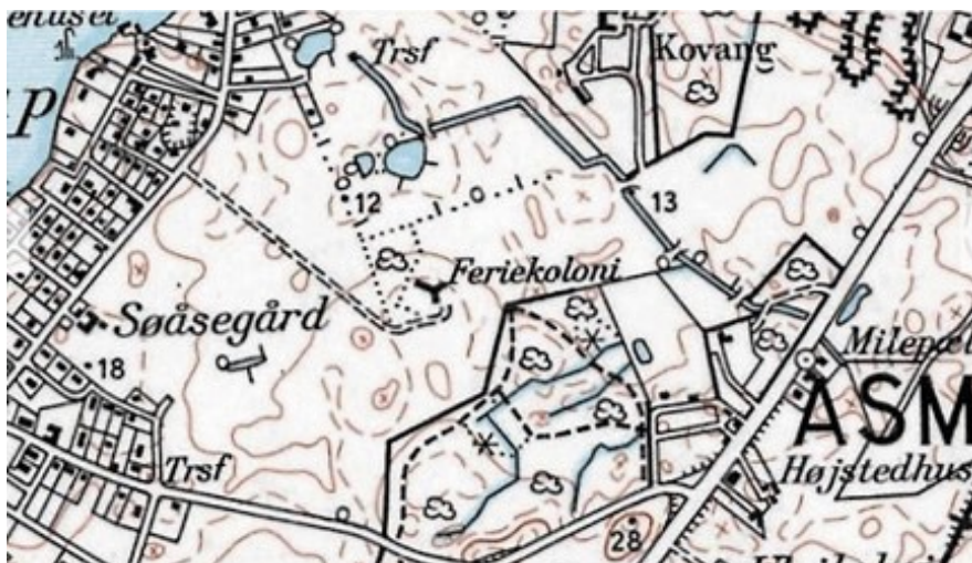
Angivelse af beliggenhed og adgangsvej (udsnit af Topografisk kort 1953-76)

Der var plads til 36 børn om sommeren, hvor bygningerne kunne benyttes i en periode på fire måneder. Formanden for Børneringen udtalte i 1977, at de mange børn kan hente sundhed heroppe i Sørup. "Sundhed er mere end sund fysik. Der er blandt andet mange psykiske problemer blandt de børn vi har ansvaret for. Jeg tror, at vi blandt andet her i Sørup kan hjælpe med at give disse små mere balance i tilværelsen."