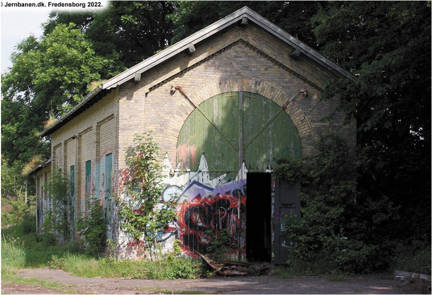
Lokomotivremisen før branden november 2022.

Men lad os i dag glæde os over, at Lokaltog A/S plejer bygningerne og har tilendebragt den indvendige istandsættelse af ventesalene og med storsind har givet os mulighed for med tre fotostater at minde om, at det er et vigtigt kulturhistorisk anlæg, som i det store og hele står intakt den dag i dag.