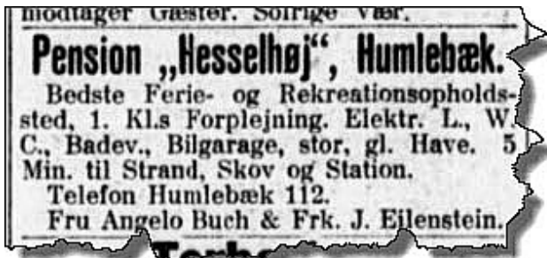
Annonce i Nationaltidende fra 1916

Villa Hesselhøj (oprindeligt med navnet: »Porro« som der stod på gavlen) repræsenterer i Humlebæk en særlig type huse med kortvarig storhed og et langstrakt forfald. Det blev bygget i 1897, året hvor Kystbanen blev indviet, som sommervilla for velhavende københavnere, men blev med sin placering i "3. række" fra kysten mest benyttet som lejebolig, og allerede i 1915 blev villæen forsøgt solgt som pensionat eller rekreationshjem.