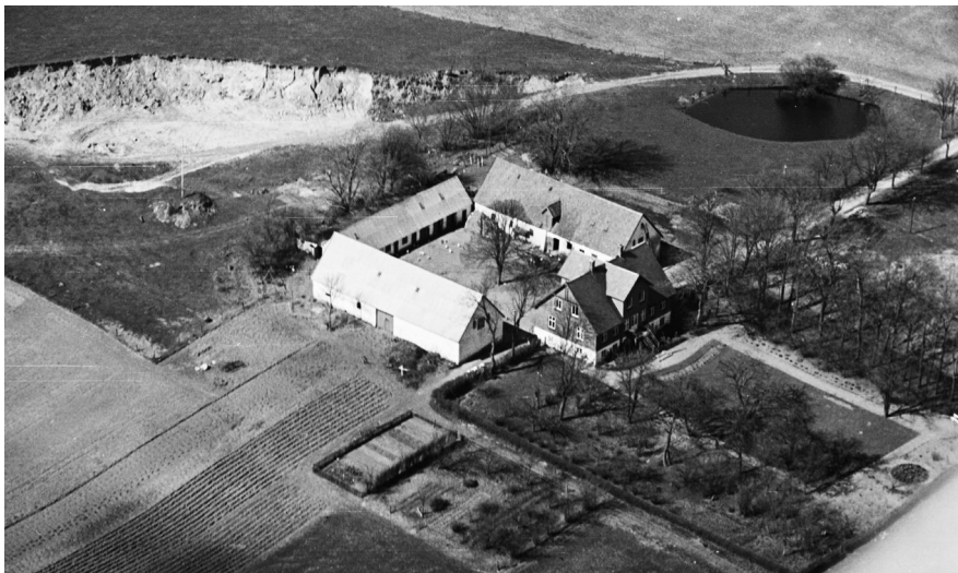
Grusgraven ved Baunebjerggård