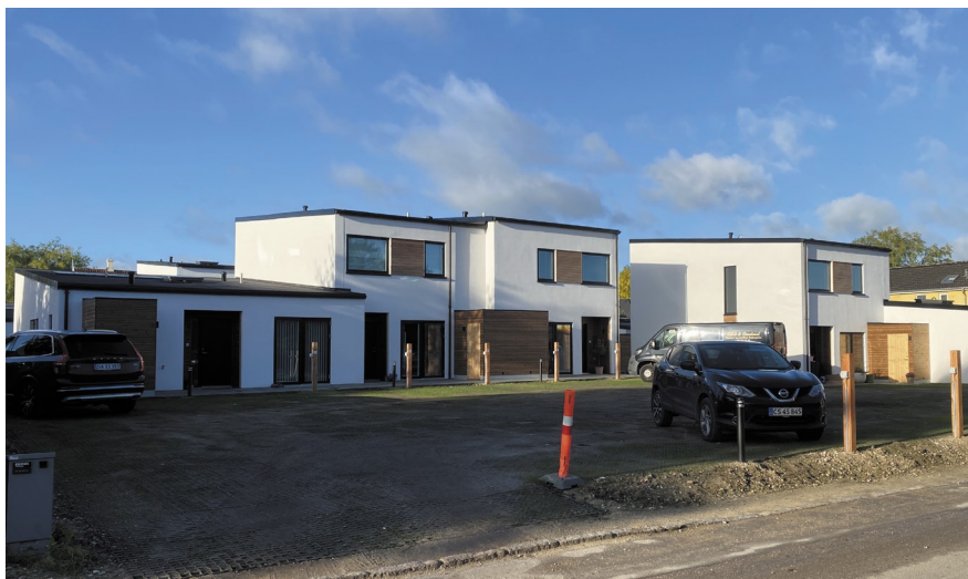
Humlebæk Strandhuse 2022

Byggeriet stod færdigt og indflytningsklart i sensommeren 2021 med alle 10 boliger udlejet.