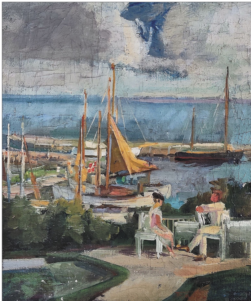
Carl Forup maleri fra omkr. 1930 af Humlebæk Havn set fra Humlehøj.