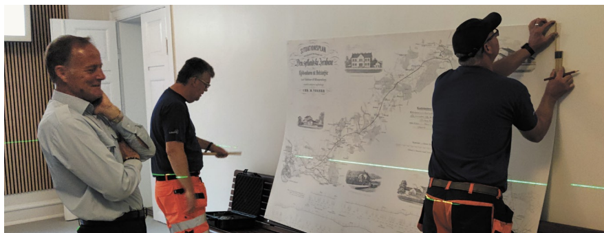
Medarbejdere fra Lokaltog A/S sætter fotostat op.

på den ene væg et kort med Nordbanens vinklede forløb, som det så ud ved indvielsen d. 8. juni 1864 for snart 160 år siden. Bortset fra sporføringen inde i København er forløbet stadig det samme.