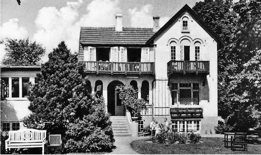
Villa Hesselhøj i 1950'erne

Villa Hesselhøj (oprindeligt med navnet: »Porro« som der stod på gavlen) repræsenterer i Humlebæk en særlig type huse med kortvarig storhed og et langstrakt forfald. Det blev bygget i 1897, året hvor Kystbanen blev indviet, som sommervilla for velhavende københavnere, men blev med sin placering i "3. række" fra kysten mest benyttet som lejebolig, og allerede i 1915 blev villæen forsøgt solgt som pensionat eller rekreationshjem.