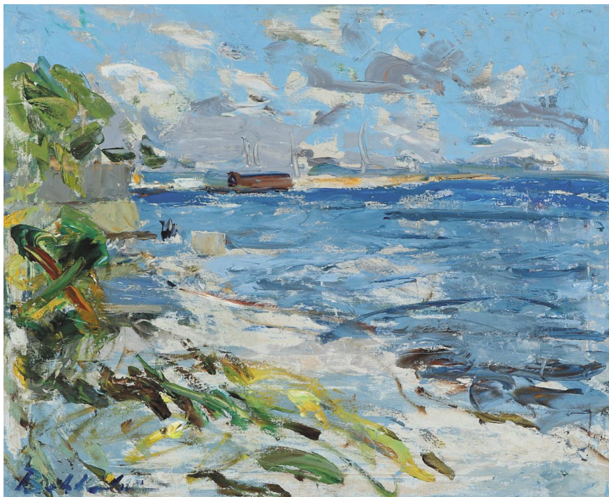
Øresundskysten malet af Hans Andreasens ven Børge Bokkenheuser.

det og belagt med spiritusforbud og spiseforbud, overfaldet af asketer og lyselukkere, af en skare som aldrig har kendt til tørst. Nu hakker Frederik Mensa ikke mere, og intet glider forbi, tågen lukker for alt udsyn og lukket for hørelsen også. Man bliver så ensom ude på molen, hjælpeløs som en opskyllet krabbe, lukket ude fra sin verden. Og afstanden ind til havnepladsen virker så uendelig. Man er et lille, frysende menneske, synes at solen skrumper ind og bliver så foruroligende smal. Den kække vandrer svimler og sætter i trav indad, indad. Når fiskehandleren og hører stemmer, døren der smækker op og i. Føler det som om man var længe, længe borte.