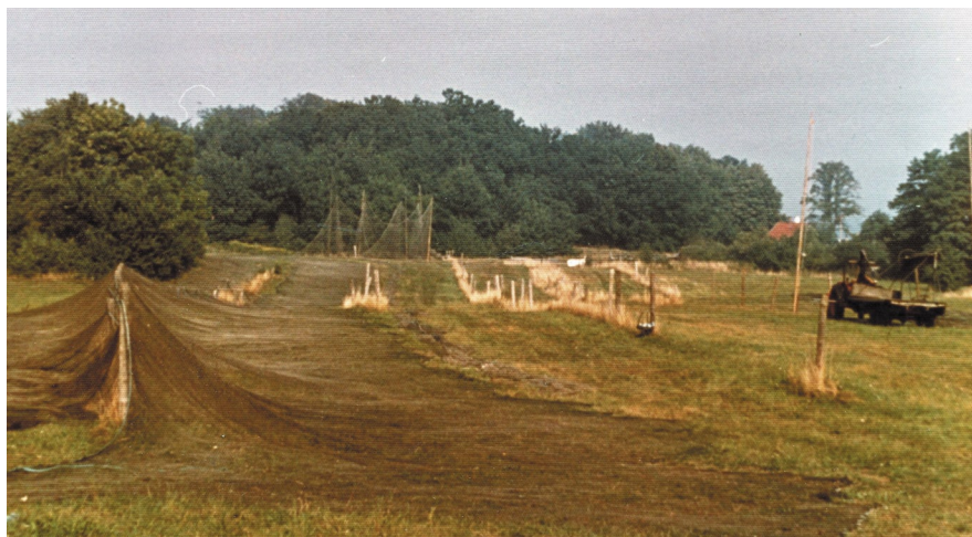
Stejlepladsen ved Humlebæk Havn

Tangenten. [Politiken, Dag til dag, 02-02-1961]