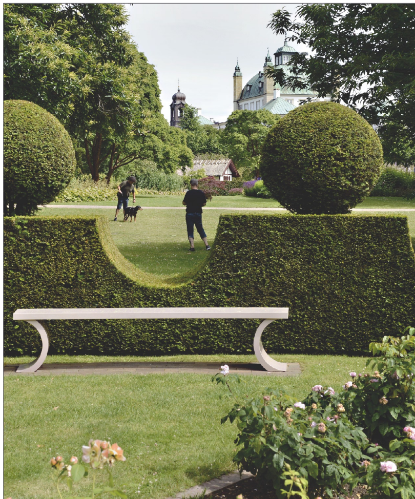
Fredensborg Slot og Slotshave