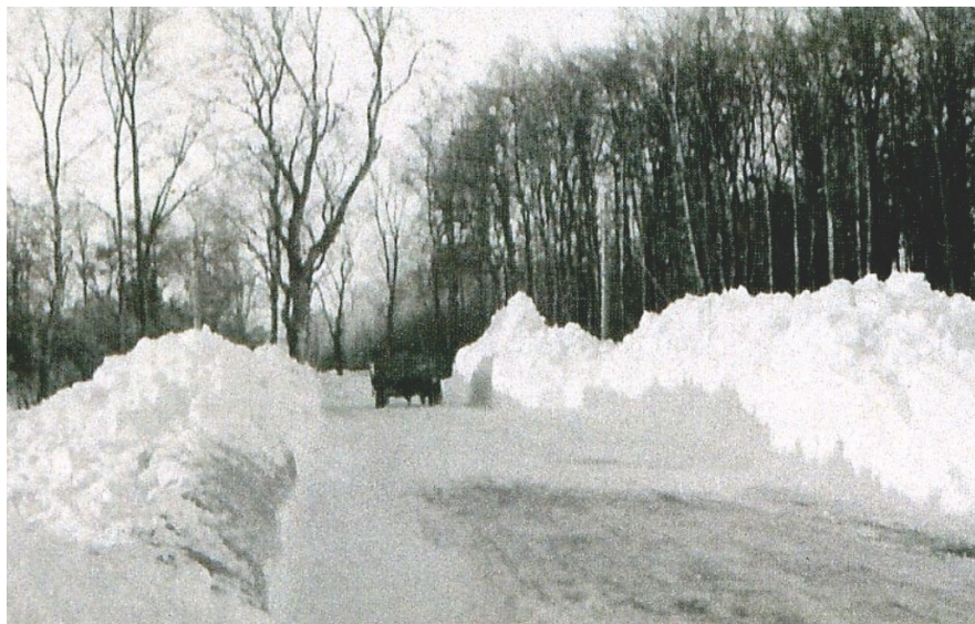
Gammel Strandvej ryddet med håndkraft i 1942.

Arbejdet var en personlig forpligtelse, men kunne udføres af f.eks. gård-ejerens karl med eller uden hest.