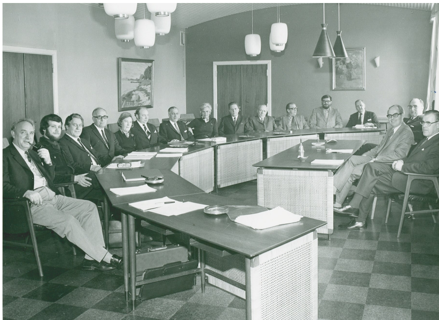
Byrådet 1970-74 med de fleste medlemmer omtalt i artiklen på billedet.

Dermed stod beslutningen fra november 1970 fast. Og den 19. maj 1971 – over et år efter kommunalreformen, skrev daværende indenrigsminister H. C. Toff under på en godkendelse af navneændringen. Den rigtige dato for navneændringen er derfor denne dato, hvorefter alle relevante afdelinger og kommunale institutioner skulle anvende navnet “Fredensborg-Humlebæk”.