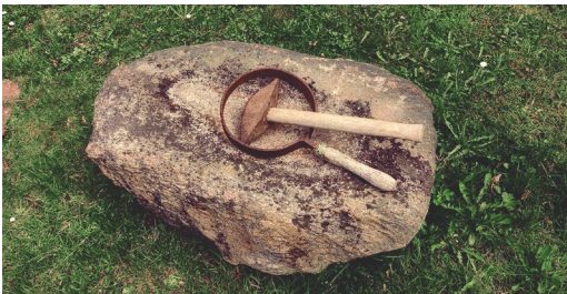
Skærveslagerens værktøj: Hammer og skærvering. (Genstande fra Fredensborg Museum)

Oprikelig var vejene grusbelagte, hvorfor der hvert år måtte påføres mere grus og belægningen udjævnes. Gruset kom fra lokale grusgrave, som fortsat kan anes i landskabet. Enkelte veje blev forbedret med stenskærver, men senere blev de fleste veje også belagt med stenskærver. Jens Vejmand var derfor en efterspurgt herre. (prov. ukendt)