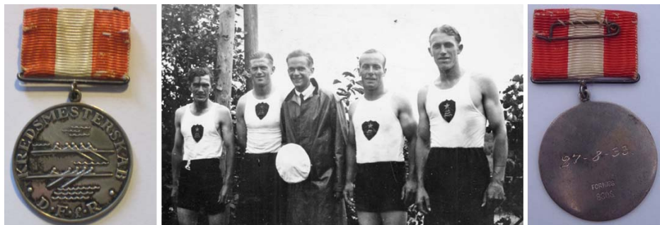
For- og bagside af sølvmedaljen fra 1933 samt besætningen, de fire plus styrmand, som vandt kredsmesterskabet i 1933.