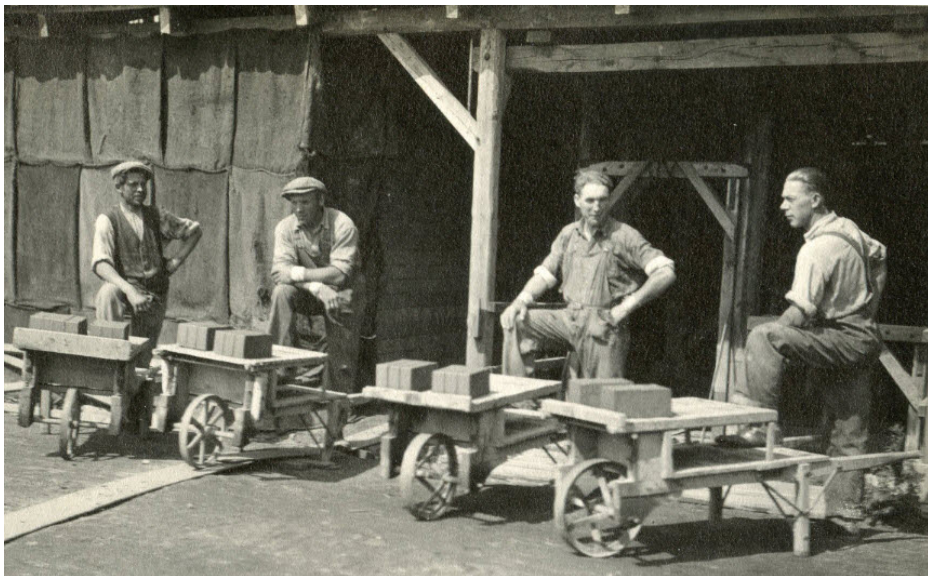
Teglværksarbejdere på Humlebæk Teglværk ca. 1935.

Det er en spændende historie, der ligger gemt i billederne. Vi følger den fattige landarbejderfamilie, når de er blevet stillet op til fotografering i deres stiveste puds. Vi kommer tæt på den rige grosserer, teglværksarbejderne og den voksende middelklasse, der tager på busture i 1960'erne.