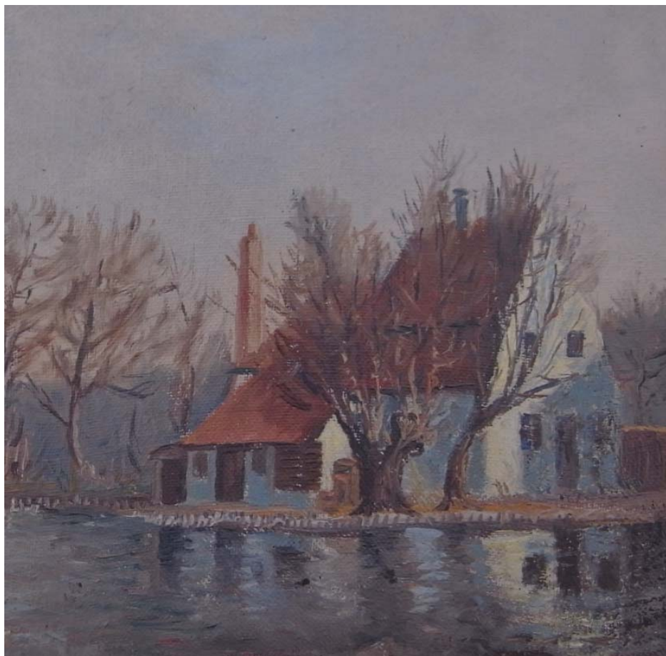
Skipperhuset - Malet af billedskærer A. Andersson omkr. 1930 (privateje).

Medlemsblad for FREDENSBORG-HUMLEBÆK LOKALHISTORISKE FORENING 2. årgang nr. 2 – Efterår 2015