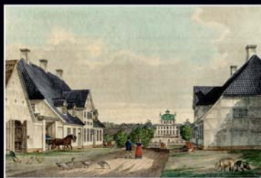
Fredensborg kunst og kunstnerliv

Bøgerne er nu fordelt til alle foreningens medlemmer, men kan stadig købes i Fredensborg Boghandel og SuperBrugsen Fredensborg for lige under 400 kr.