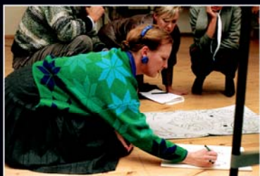
Fredensborg kunst og kunstnerliv