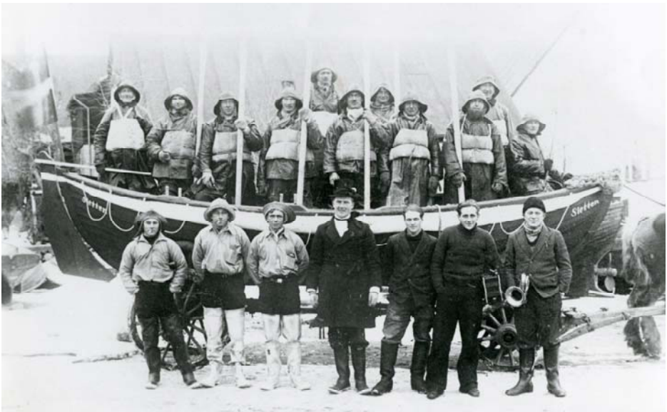
Redningsbåden Sletten med mandskab ca. 1930.

Opgaven med at registrere de lokalhistoriske fotografier varetages af en gruppe frivillige, der alle brænder for at videregive historien til fremtidens generationer. De yder en fantastisk indsats, og der er altid plads til en til. Så hvis du brænder for lokalområdet historie, er du måske arkivets næste frivillige? Hvis du er interesseret, er du meget velkommen til at kontakte arkivet på telefon: 72 56 33 33, arkiverne@fredensborg.dk eller til at komme forbi til en snak.