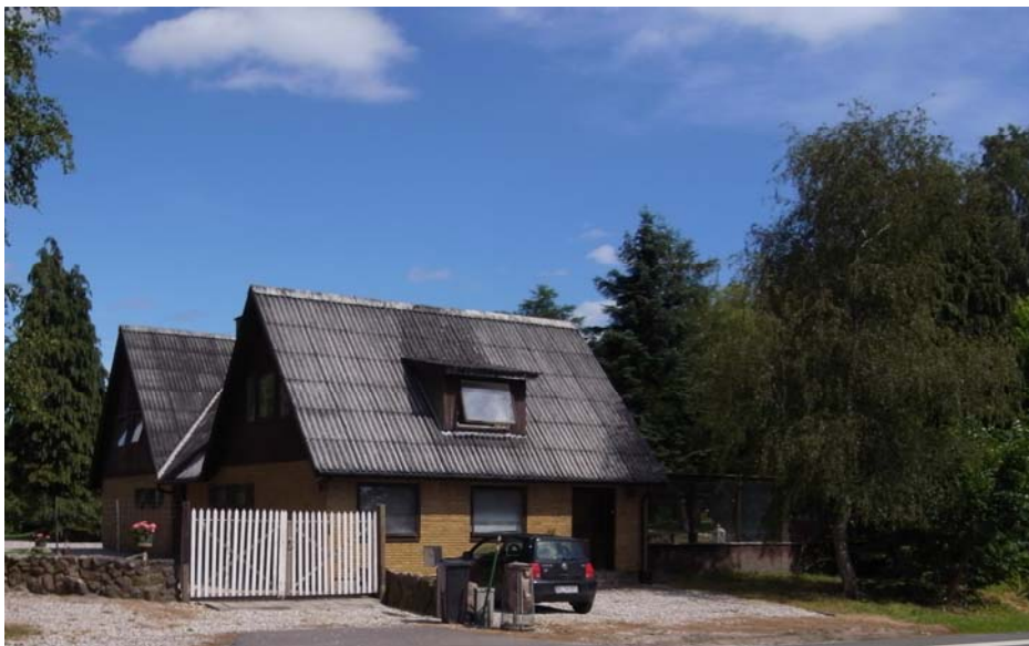
Nyere bygninger på toppen af Kirkebjergbakken i Lønholt, Kongevejen 73.