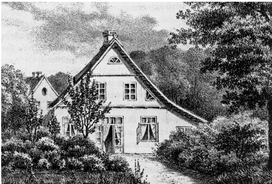
I villaen Florahøj mødtes mange af 1800-tallets kendteste skuespillere.

I den netop udkomne bog "Fredensborg – kunst og kunstnerliv" er der også omtaler af de ejendomme, kunstnerne har boet i. Blandt dem er villaen