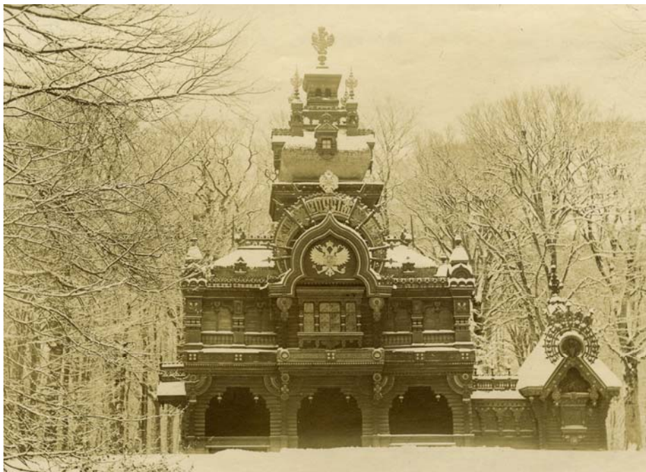
Den russiske pavillon i Fredensborg Slotspark ca. 1907. Pavillonen stammede fra en stor udstilling i København i 1888. Den blev flyttet til Fredensborg Slotspark året efter og nedrevet i 1919.

Gadebilledets skiftende udseende, tøjmodens skiftende luner, årstidernes (og årenes) skifte bliver alt sammen dokumenteret i dette store fotoalbum.