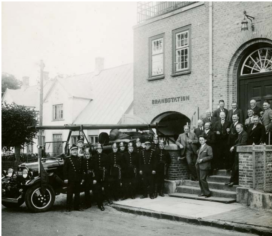
Asminderød-Grønholt Brandvæsen med brandsprøjte 1927.

"Danes access nearly two million historic images"