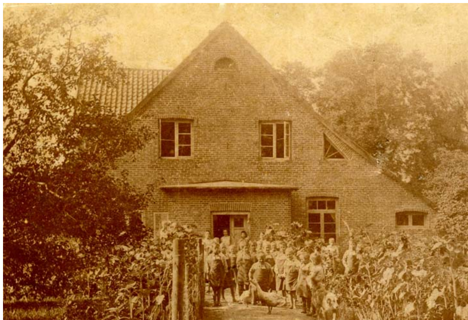
Florahøj blev indrettet til skolehjem omkr. 1910.