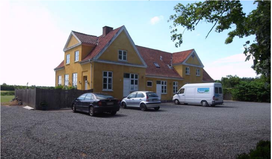
Lønholt skole, som den smukt istandsat tager sig ud i dag. Skolen blev opført i 1912 og udvidet i 1922 med den østlige fløj. Den blev lukket i 1940, hvor kommunen omdannede den til udlejningsbolig med seks lejligheder. Fredensborg-Humlebæk kommune afhændede bygningen 1998.