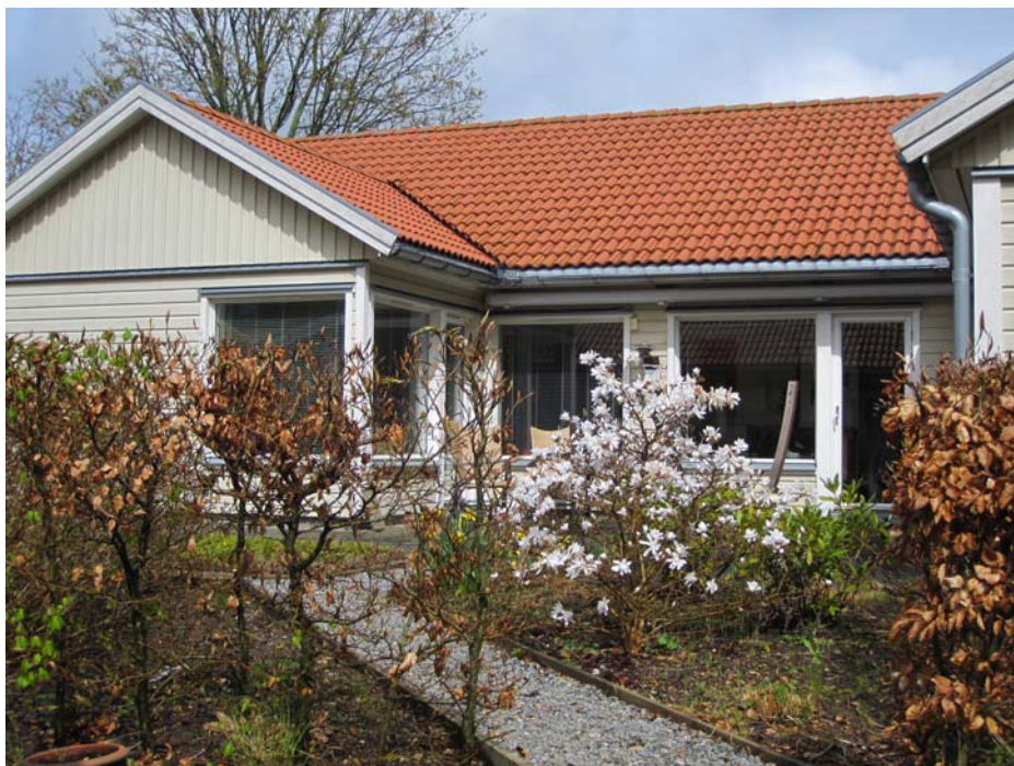
Florahøj er bygget som 20 svenske træhuse samt et fælleshus. Arkitekten har udnyttet grunden bedst muligt, idet husene er bygget både som enkelte huse og som to eller tre huse sammenbygget.

Vi har også aktiviteter uden for bebyggelsen, som bowling, stavgang og teaterbesøg.