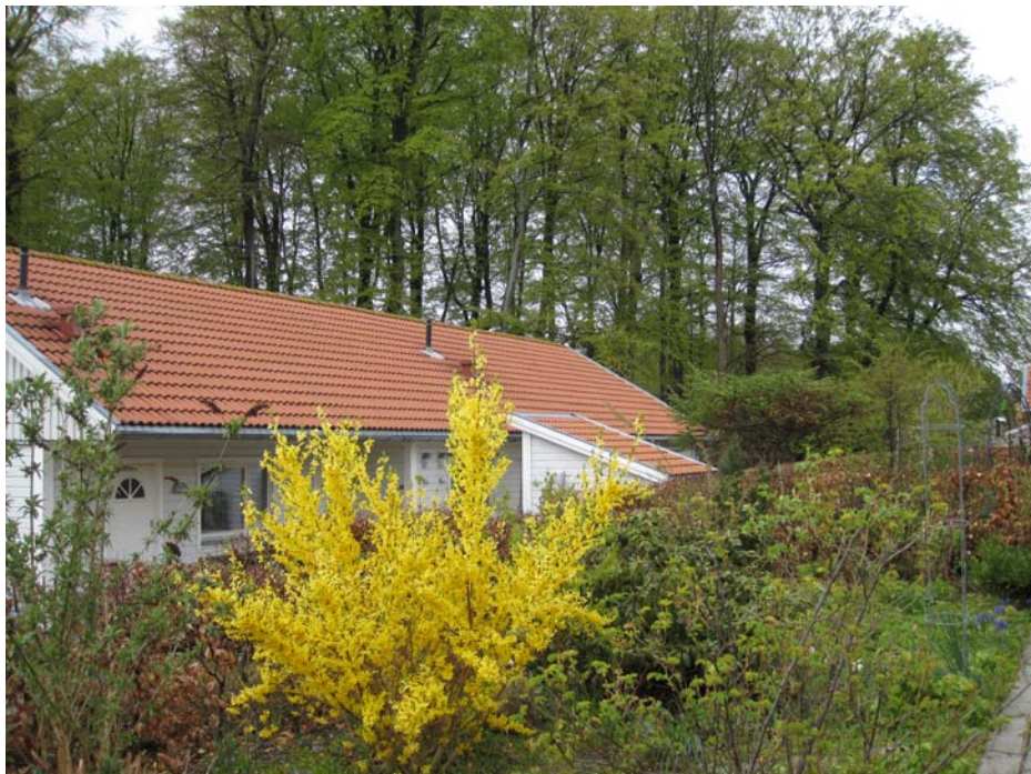
Byggeriet omkranser den store høj med bøgetræer, der er til stor glæde for beboerne, - ikke mindst farverne forår og efterår.

Andelsboligforeningen har en interesseliste, der i øjeblikket indeholder over 30 navne, og kravene til indflytning er, at man skal være fyldt 50 år og ikke over 70 ved indflytningen.