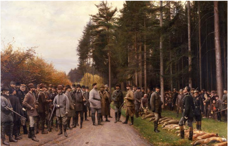
Vildtparade i Gl. Grønholt Hegn 1889. Maleri af H.O. Brasen 1890-92 (Frederiksborgmuseet)

Foruden på sådanne små ture fik kejseren stundom lidt ro for publikum, politi og presse, når han med et ganske lille følge tog på jagtudflugt i Gribskov, en adspredelse, som han satte stor pris på. Ved sådanne lejligheder forlod han slottet meget tidlig om morgenen, en enkelt gang overnattede han endog i den anledning på Egelund, som dengang endnu var overførstergård, og hvor det fine besøg naturligvis satte huset på den anden Ende.