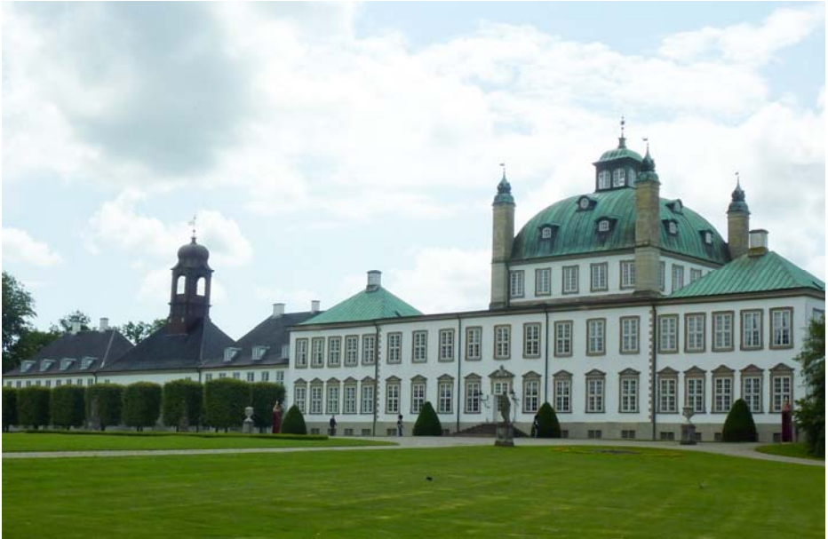
Kejserparret boede under deres ophold på slottets anden sal i den vestre fløj med udsigt mod bl.a. Kovangen.

frederiksborgere o.s.v., og hver hest - i alt fald hver ridehest – havde sit navn.