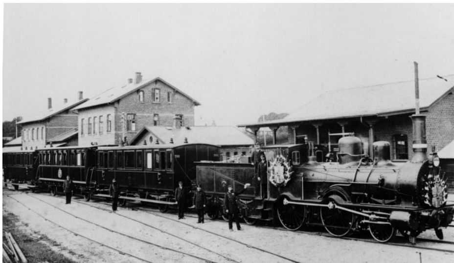
Kongeligt særtog klar til afgang fra Fredensborg Station omkr. 1890. Toget er udsmykket i anledning af den kongelige transport.

i kraftige hurraråb, da de elegante ekvipager med jægere, røde kuskke og kejserens pompøse livkosak på bukken rullede ad Amaliegade, St. Strandstræde og gennem Strøget til banegården. Fra alle huse vavede flag, mange ejendomme var dekorerede, og ridende politi samt husarer holdt orden. I gaderne stod menneskemængden hoved ved hoved, og hurraråb og en regn af blomster mødte de kongelige gæster overalt, hvor de kom frem.