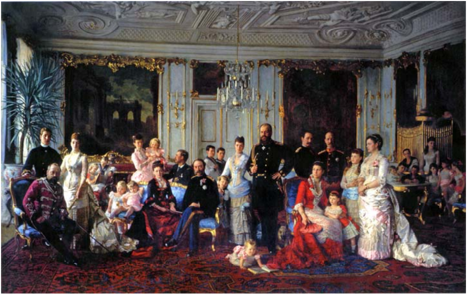
Laurits Tuxens gruppebillede med Christian IX og dronning Louise og familien i Havesalen på Fredensborg - malet 1883-1886 (Christiansborgs malerisamling).

Det var således en stor kreds af slægtninge, der flokkedes om Kong Christian og Dronning Louise, for efterhånden voksede jo også børnebørnenes skare. På Tuxens bekendte billede, der blev malet i begyndelsen af firserne, ser man en vrimmel af små prinser og prinsesser i havesalen på Fredensborg, hvor kongen og dronningen allerede i treserne og halvfjerdsene jævnlig havde samlet slægten. Det var dog først, efter at storfyrsttronefølgeren havde overtaget regeringen og i 1883 som kejser Alexander III aflagde besøg i Danmark – et besøg, som i de påfølgende ti år stadig gentoges – at det danske hof og Fredensborg tiltrak sig hele Europas opmærksomhed, og at man trods alle forsikringer om, at fyrstebesøgene kun var helliget familielivets og ferielivets Glæder, i diplomatiske kredse og pressekrede omkring i verden grundede på, hvilke politiske tråde der mulig blev spundet på Fredensborg.