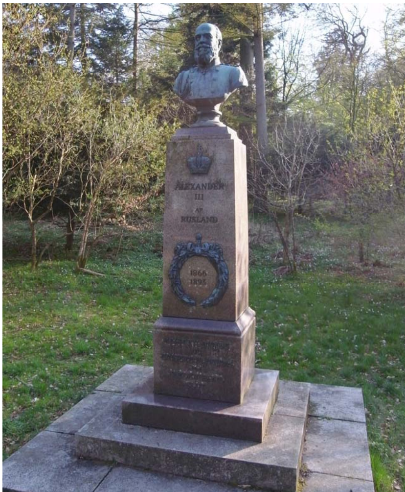
Buste af Alexander III i Fredensborg Slotspark

Medlemsblad for FREDENSBORG-HUMLEBÆK LOKALHISTORISKE FORENING 2. årgang - særnummer 1 - 2015