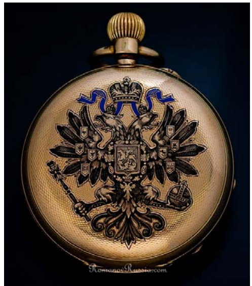
Et af de berømte Pavel Buhre ure, som kejseren bl.a. skænkede stationsforstanderen i Fredensborg.

Det er underligt at tænke på, at medens alle de kostbarheder, som kejseren engang besad, er splittet og annekterede så er disse beskædede genstande endnu bevarede. Om ikke særlig mange år, når vi, der har levet med i hin tid, ikke er mere, vil Kejserdagene som så mange andre minder, der knytter sig til det gamle slot, være historie. Men for alle de, som dengang fulgte livet på Fredensborg, bliver minderne endnu levende i disse omgivelser, og man forstår knap, at et så langt tidsrum og så mange store begivenheder skiller os fra hin tid, da det gamle kongepar og dets slægt tilbragte så mange lykkelige timer på Fredensborg.