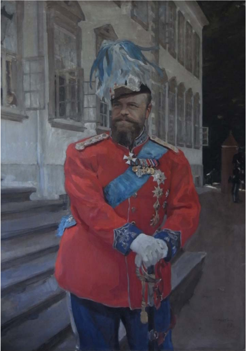
Alexander III i Livgardens røde officersgalla malet af V. Serov. (Livgarden)