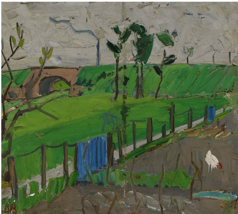
En af Kystbanens jernbaneviadukter. Malet af Børge Bokkenheuser.

Medlemsblad for FREDENSBORG-HUMLEBÆK LOKALHISTORISKE FORENING 4. årgang nr. 1 – forår 2017